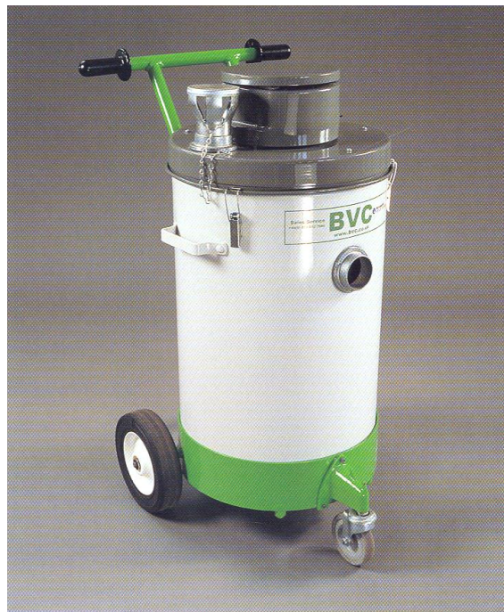
IV 40 sur chariot