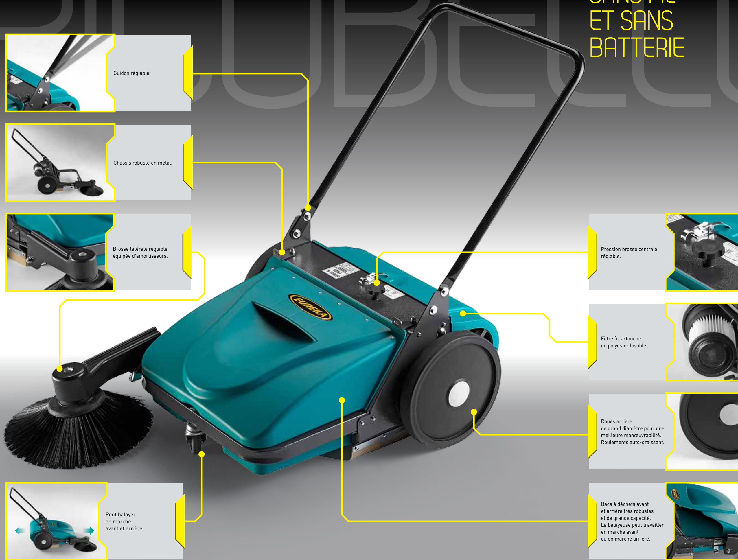
Pression brosse centrale réglable.