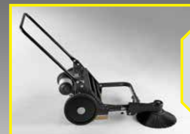
Châssis robuste en métal.