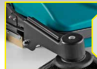
Brosse latérale réglable équipée d'amortisseurs.