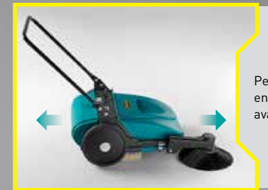
Peut balayer en marche avant et arrière.